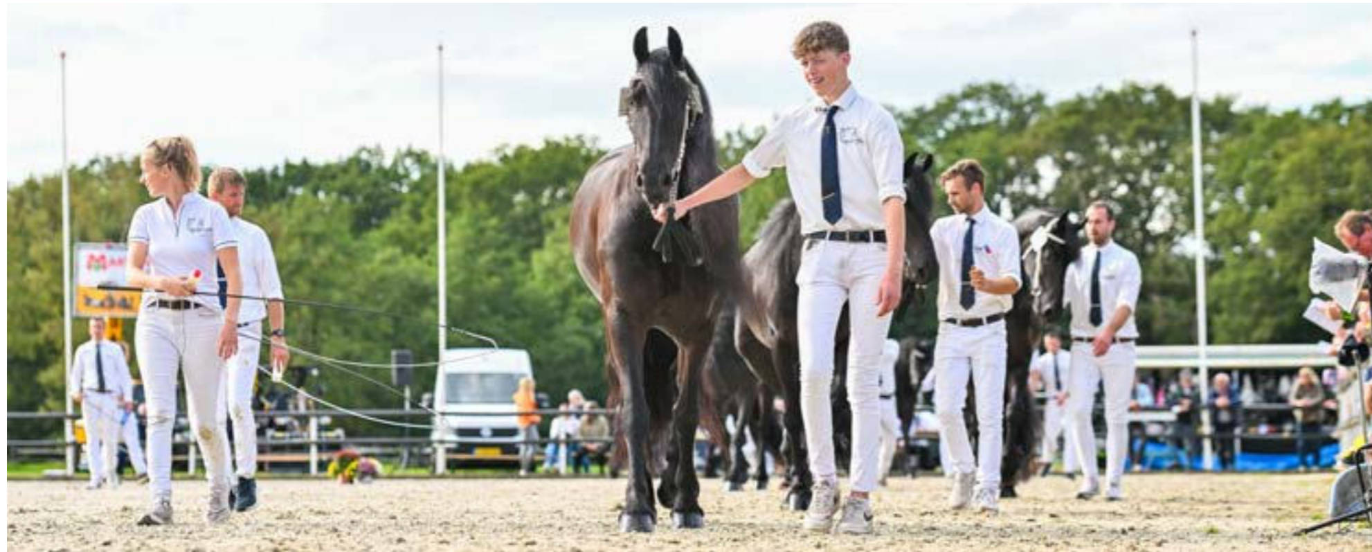
Tekst: Johanna Faber * Foto: Johanna Faber